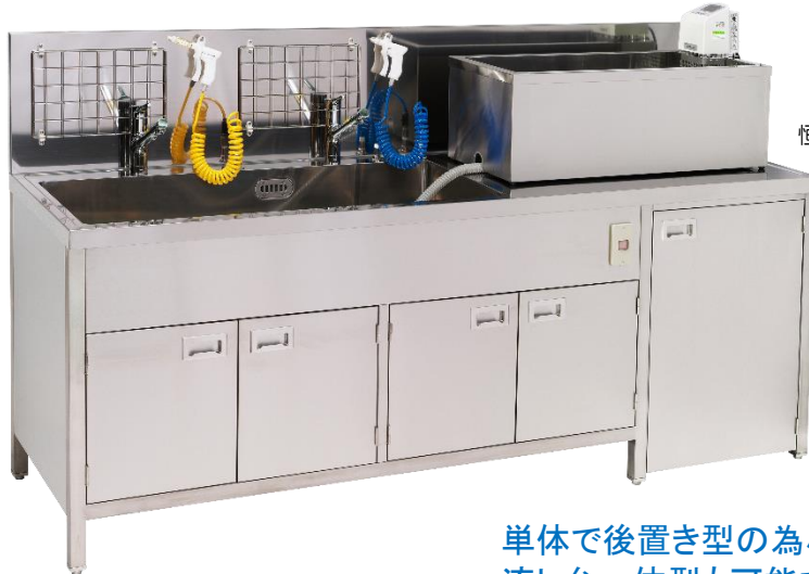
恒温槽設置イメージ