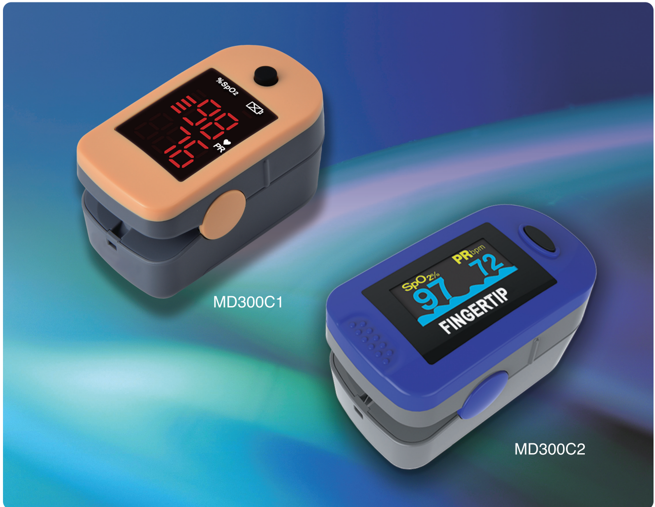
ストラップ・シリコンカバー（半透明）付

小児、成人向けパルスオキシメーターです。 コンパクトなデザインで、医療機関、家庭、救急車等で 幅広くご使用いただけます。