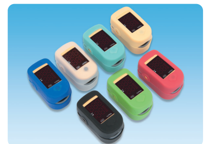
●別売：シリコンカバー（全7種）